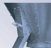
Saída para extração lateral