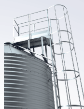
Escada com guarda-corpo