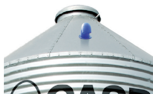
Respiro no teto